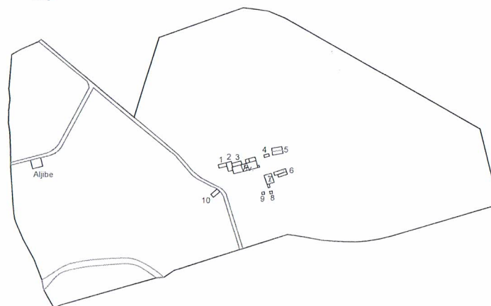
SITUACIÓN EN PARCELA