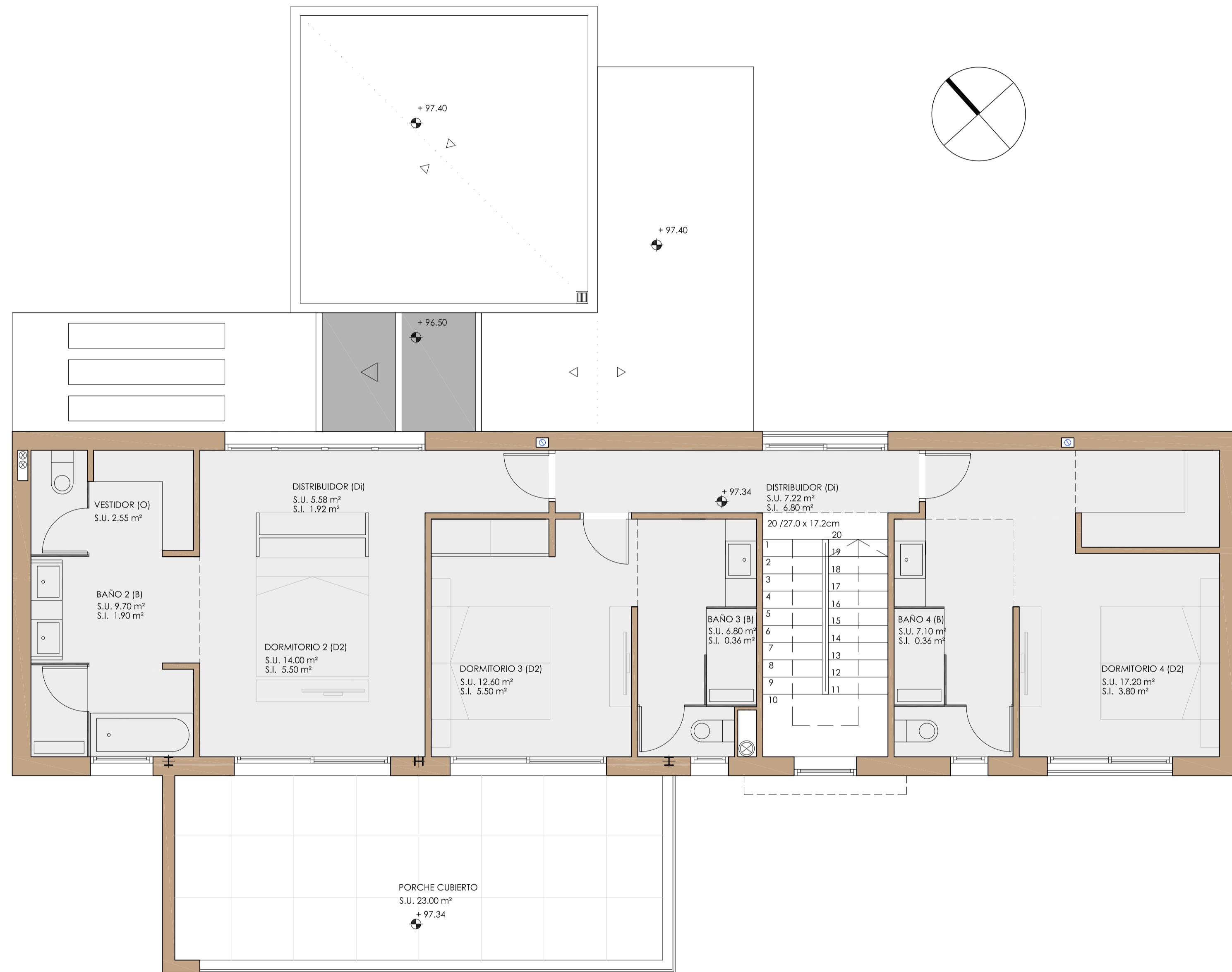
PLANTA PRIMERA . DISTRIBUCIÓN . COTAS . SUPERFICIES .