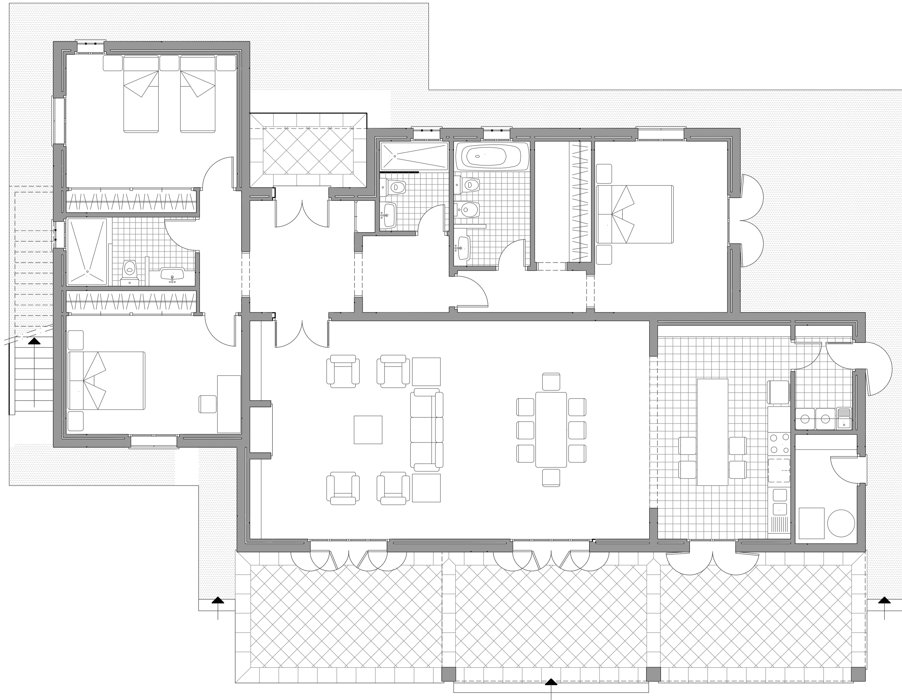
Planta baixa vivenda: distribució