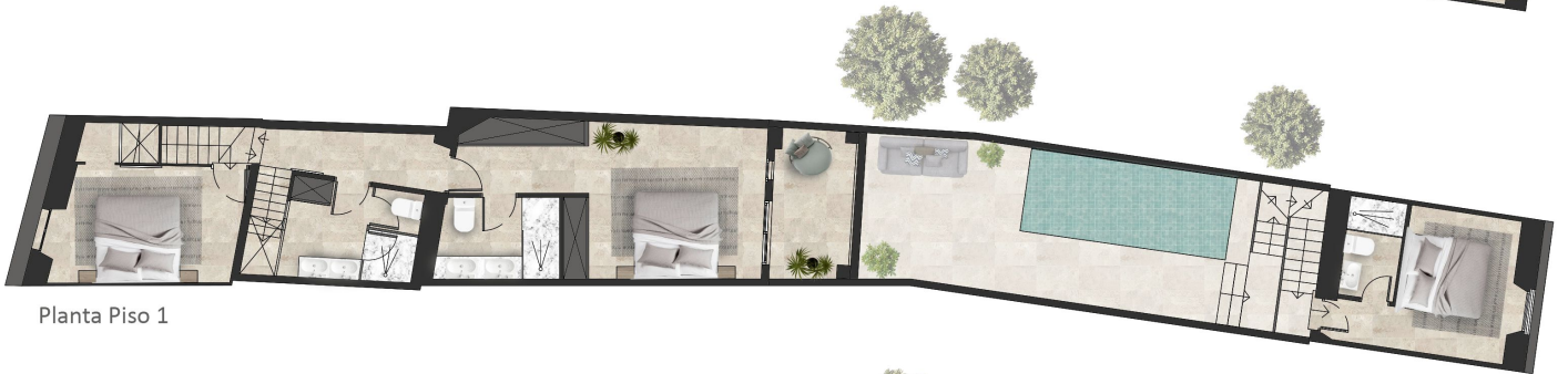
Planta Piso 1