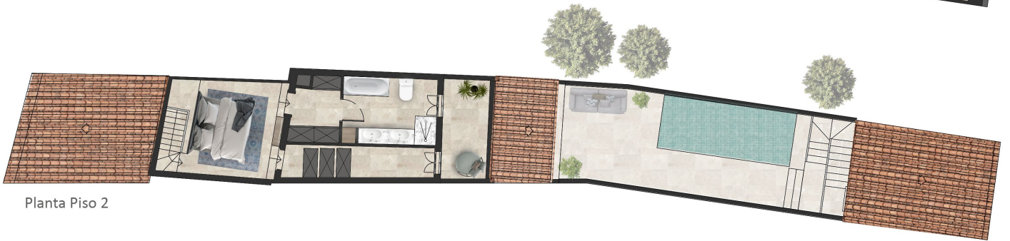
Planta Piso 2